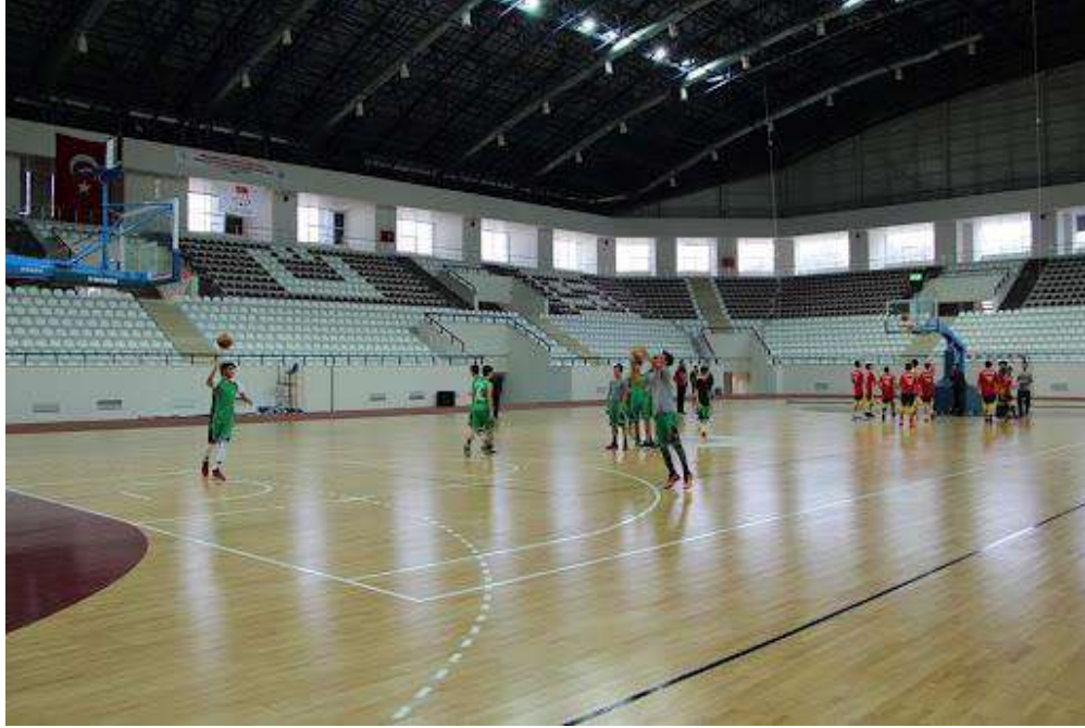
Çok amaçlı spor salonumuzda ders uygulamalarımız-2