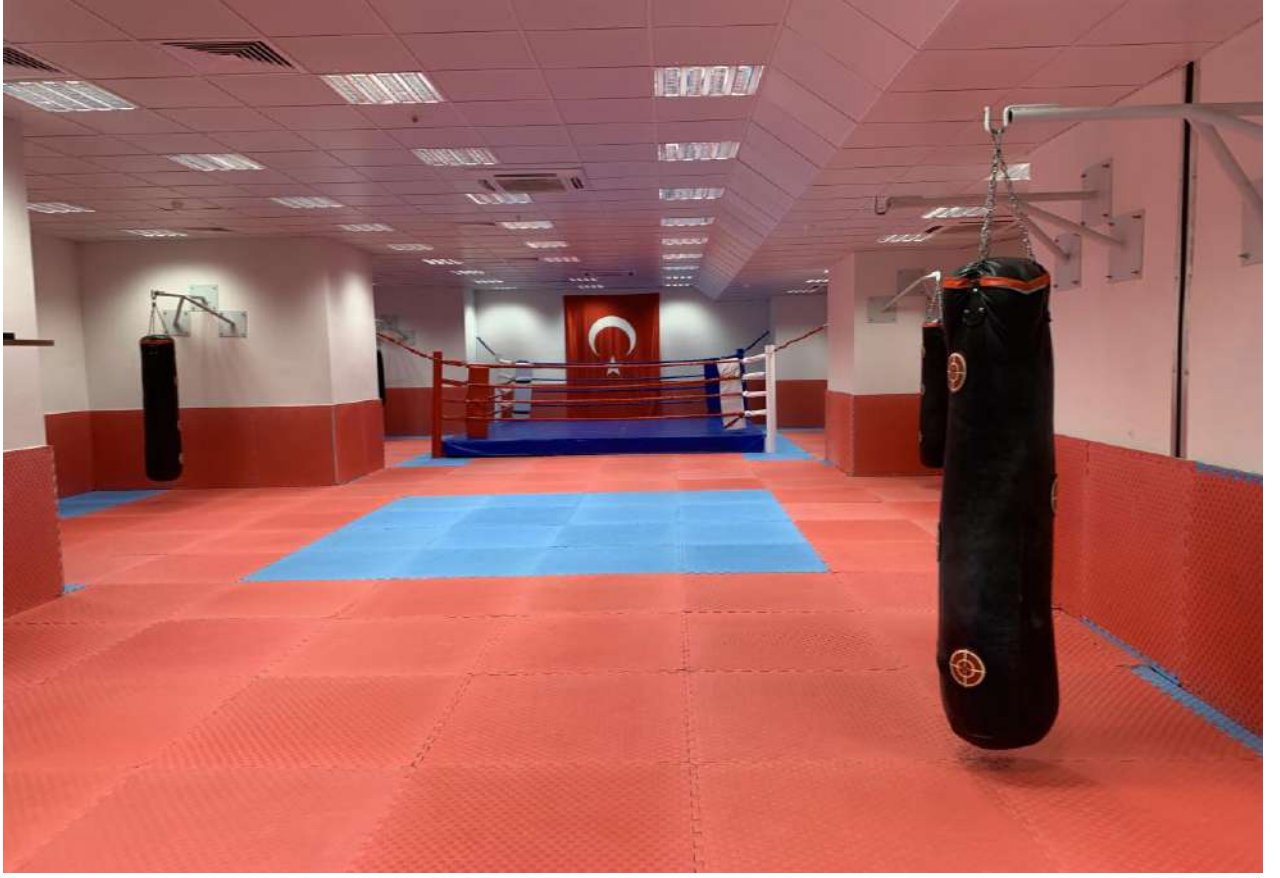
Mücadele Sporları Salonu