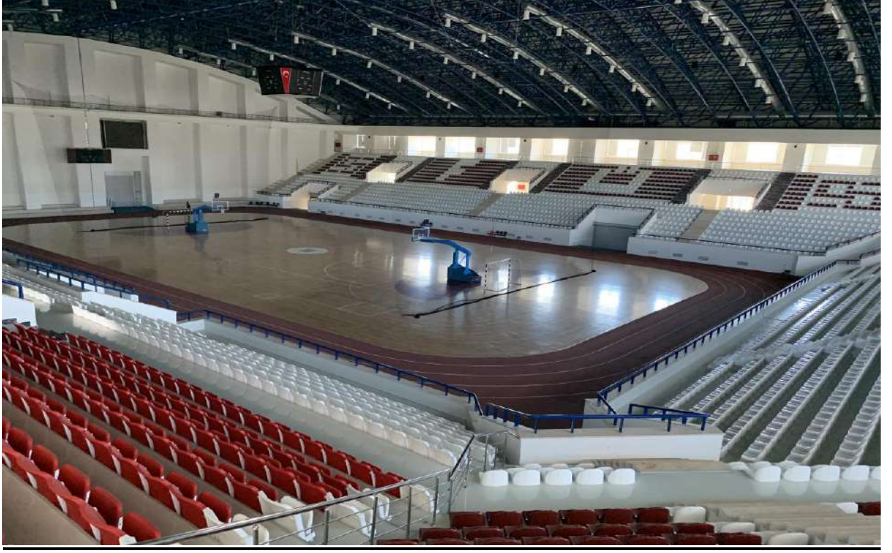
Çok Amaçlı Spor Salonu