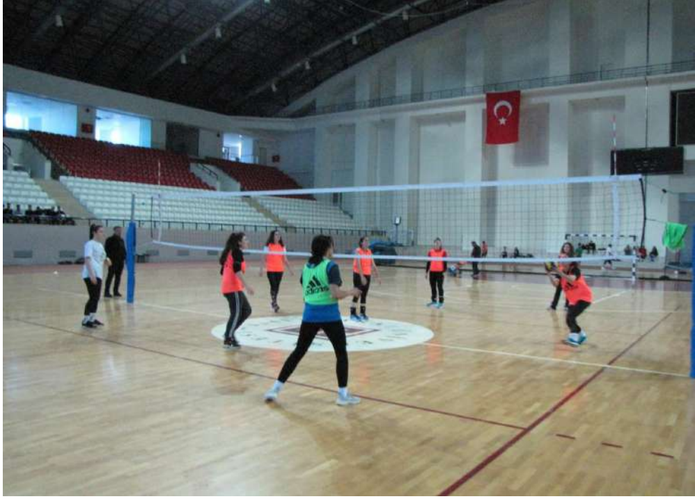
Çok amaçlı spor salonumuzda ders uygulamalarımız-1